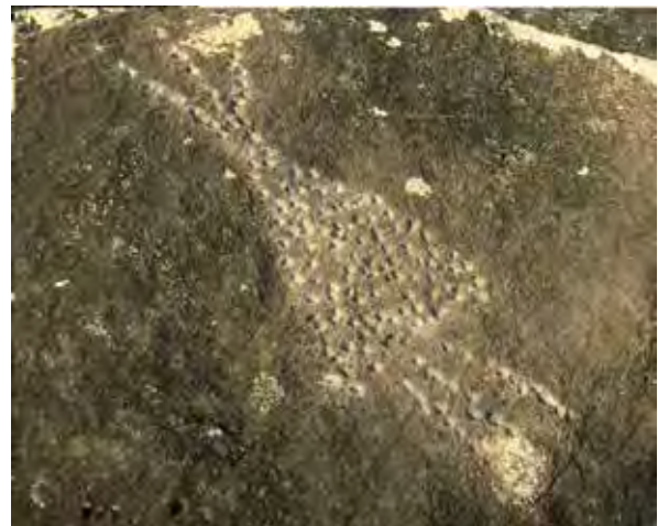
Elarmekora – figure triangulaire au piquetage accentué, munie de trois digitations disposées au sommet ainsi qu'à la base.

Sa dernière forme, la plus compliquée et la plus intéressante, montre de nouvelles courbes digitées et deux cupules disposées de part et d'autre du sommet.