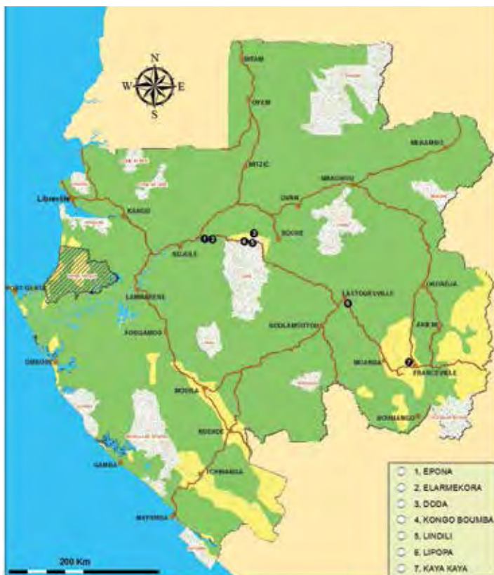
Carte des sites rupestres de la vallée de l'Ogooué.

Découvert en 1987, Elarmékora a été le premier site rupestre connu. Cet éperon rocheux culminant au-dessus du fleuve témoigne d'un art étonnant de la figuration graphique, avec