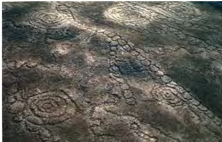
Kongo Boumba 1 – étrange composition de cercles concentriques, de chaînes de petits cercles et de traits divagants.

Le site de Kongo Boumba 7 consiste en deux énormes rochers dont les surfaces portent chacune deux compositions très différentes ; sur l'une ce sont essentiellement des cercles simples qui entourent deux cercles concentriques tandis que sur l'autre, plus complexe, on trouve cinq demi-cercles concentriques entourés de chaînes de cercles et de traits divagants.