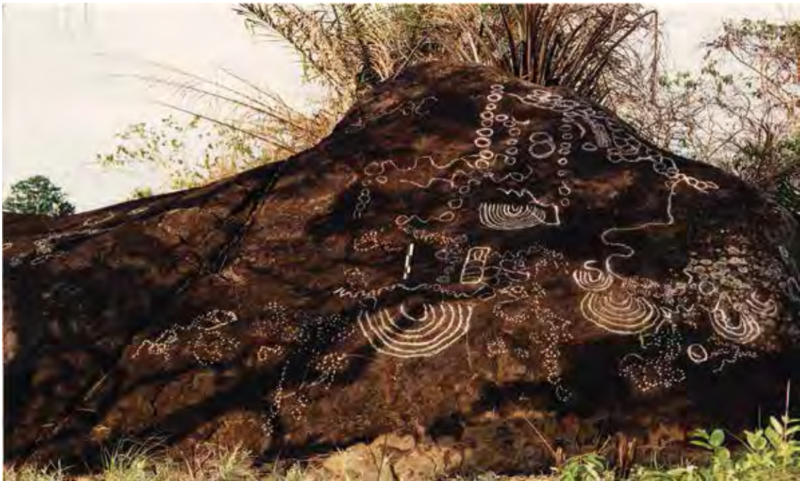
. Kongo Boumba 7 – rocher gravé de demi cercles concentriques, de traits divagants et de chaines de cercles tracés à la craie.