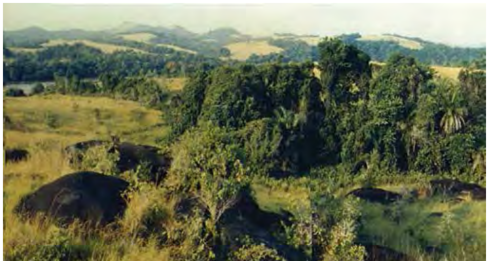
Kongo Boumba 1 – vue sur l'ensemble de rochers gravés dominant la vallée de l'Ogooué.

quartzitique déjà reconnue plus au sud, sur le site de Lindili.