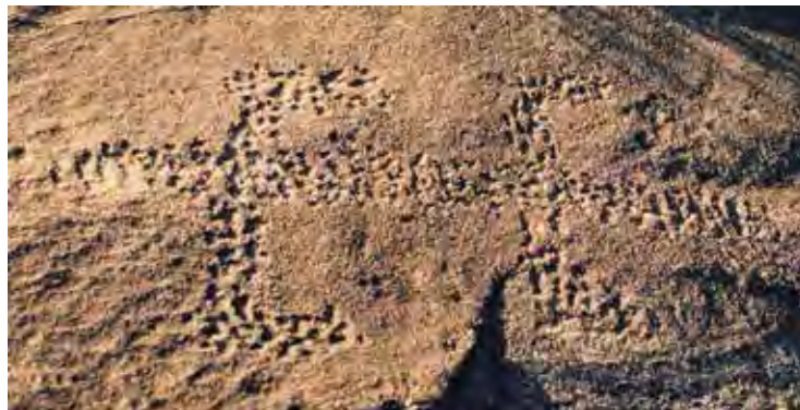
Elarmekora – Saisissante figure lézariforme qui est très fréquente dans l'iconographie africaine.

de petites cupules. Les piquetages sont homogènes mais certaines figures présentent des cupules de forme allongée et déjetée soit à droite, soit à gauche, indiquant l'utilisation d'une technique de percussion indirecte. Leur piquetage quasiment uniforme peut s'expliquer par l'utilisation d'une pointe de fer, presque inaltérable, alors que le piquetage obtenu avec un pic de pierre varie selon les transformations subies par l'instrument au cours du travail.