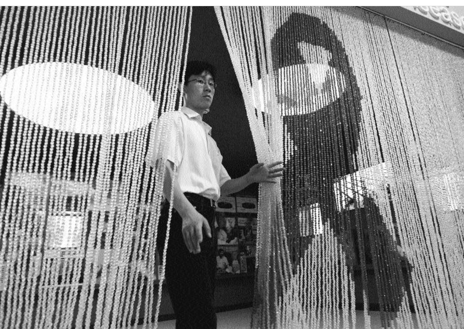
Exposition sur le Sida à Pékin. Les lacunes en matière d'éducation sexuelle sont désormais officiellement reconnues

La ligne d'action dominante consiste à préconiser le maintien des pratiques traditionnelles en matière de santé de la reproduction si elles sont compatibles avec les recommandations globalisées émanant des organismes internationaux, et de rejeter celles qui ont un impact négatif et qui représentent des obstacles à l'application des programmes. Les termes utilisés pour désigner les pratiques et les acteurs évoquent la période maoïste et l'adhésion à un schéma évolutionniste pour caractériser les populations minoritaires, conforme à celui qui était répandu en Union soviétique ; les pratiques de ces populations sont « primitives », « dépassées », « pas modernes », etc. Ces aspects de l'intervention gouvernementale mettent en évidence la continuité du discours officiel avec l'ère maoïste inspiré par le schéma de l'évolutionnisme social.