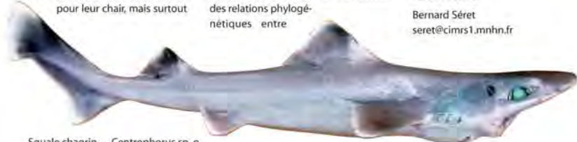
Squale chagrin, Centrophorus sp. n.