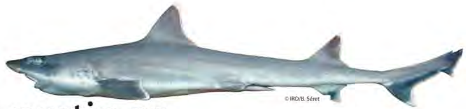
Requin hà, Hemitriakis sp. n.