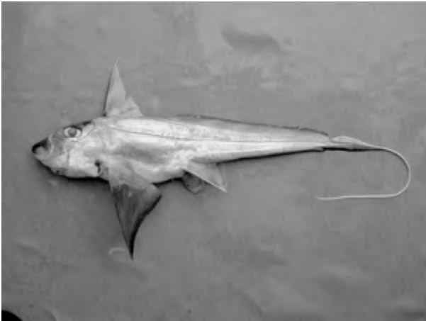
La chimère fantôme ( Chimaera phantasma ) a été chalutée par 500 mètres de fond.

Copyright © 2002 - Les Nouvelles-Calédoniennes - Tous droits réservés.