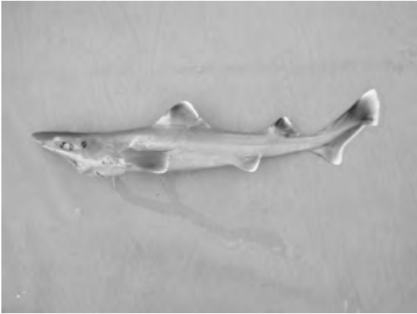
Les deux nouvelles espèces de requins découvertes par l'IRD. Il s'agit qu'un squalo-chagrin du genre Centrophorus , à gauche, et d'un requin-hâ du genre Hemitriakis , à droite.