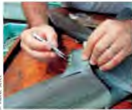
Prélèvement de parasites externes (crustacés) sur une nageoire de requin du genre squalus .