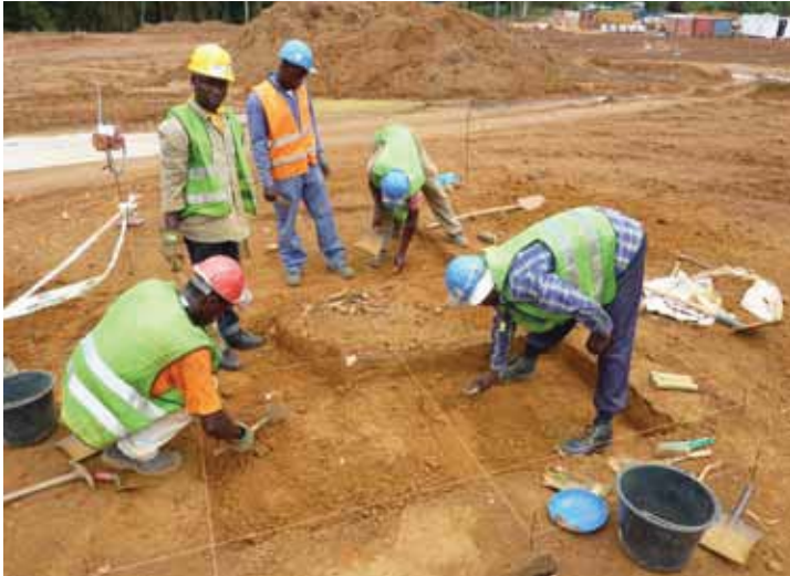
Fig. 3. Mpolongwé : phase de fouille en quadrillage.