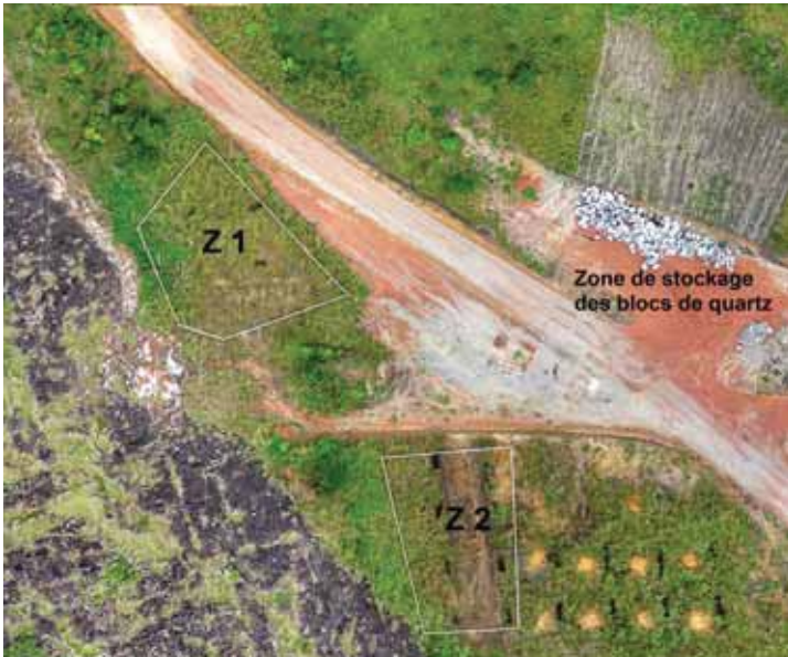
Fig. 4. Mikaka : vue aérienne par drone des zones Z1 et Z2 mises en protection ; les rectangles correspondent aux sondages réalisés lors de la phase de diagnostic (adapté de COMILOG par R. Oslisly).

Au cours de ces travaux, 50 structures archéologiques ont été découvertes, correspondant à 37 fosses, 12 niveaux archéologiques et une forge. Les vestiges matériels (392 kg) étaient constitués d'éclats de pierres taillées, de fragments de poteries, de faïence, de restes d'activité métallurgique (outils de fer), de perles et de verre.