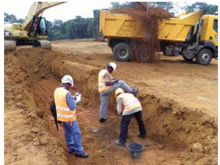
Fig. 2. Mpolongwé : découverte d'une structure en fosse (tache foncée) dans la tranchée.

La méthode de la lecture des paysages nous a permis de découvrir 52 sites sur cet axe routier long de 84 km au centre du pays. Les talus du tronçon ont été parcourus minutieusement pour obtenir le meilleur diagnostic archéologique.